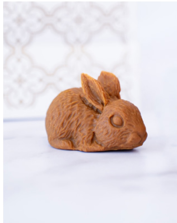
Figura de manjar duro con forma de conejo 100% artesanal.