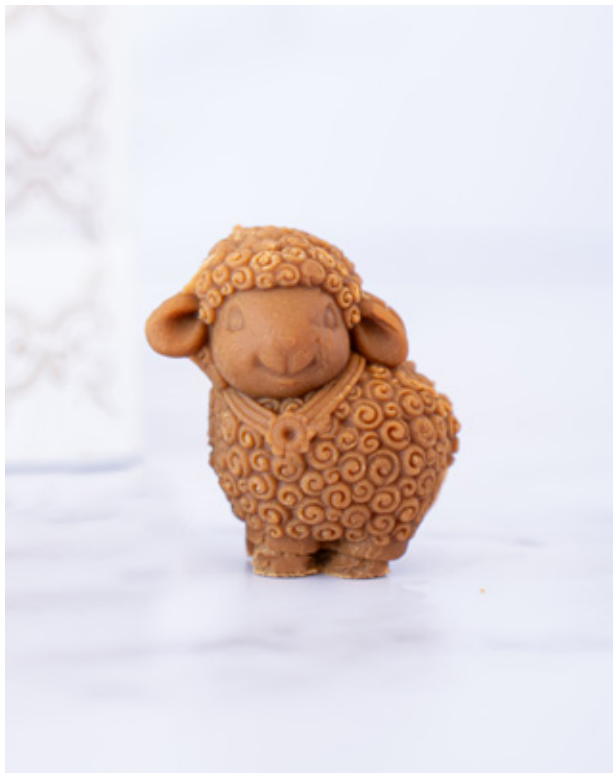
Figura de manjar duro con forma de cordero 100% artesanal.