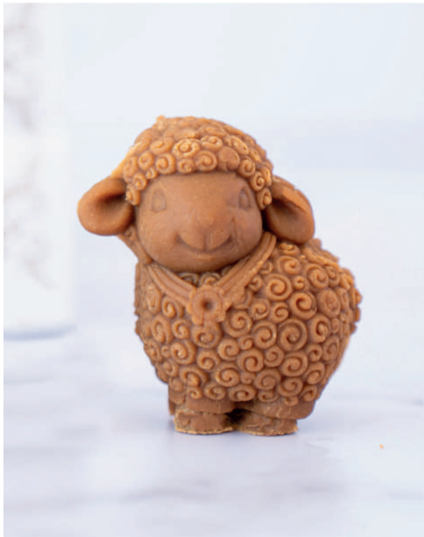
Figura de manjar duro con forma de cordero 100% artesanal.