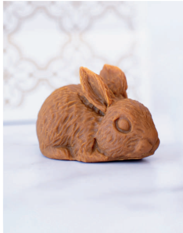
Figura de manjar duro con forma de conejo 100% artesanal.